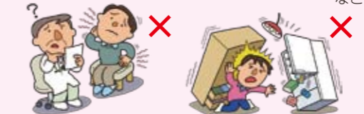
●むちうち症、腰痛などで、医学的他覚所見のないもの ●地震・噴火またはこれらによる津波によるケガ