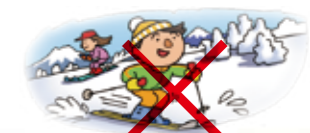
● 個人でスキーに出かけた場合